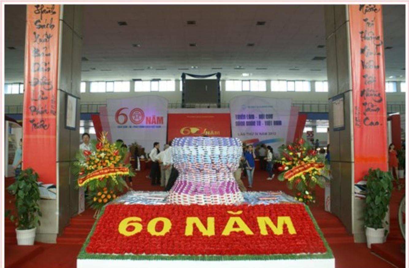
Information - Edition internationale Vietnam 2012-2013 à l'occasion du 60e anniversaire du secteur Edition -