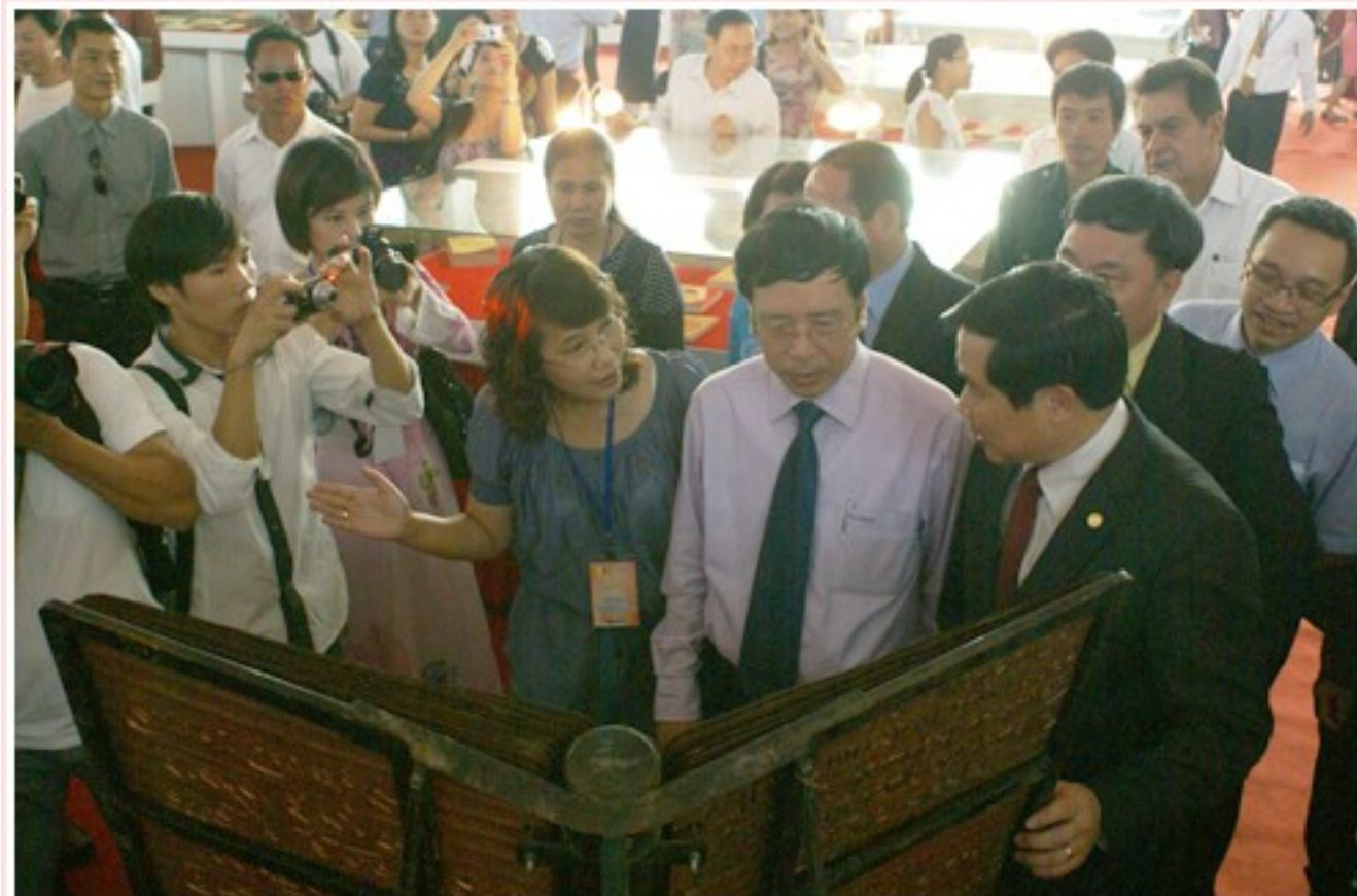
M. le Secrétaire général de la Bibliothèque nationale et de la Communication et les invités en