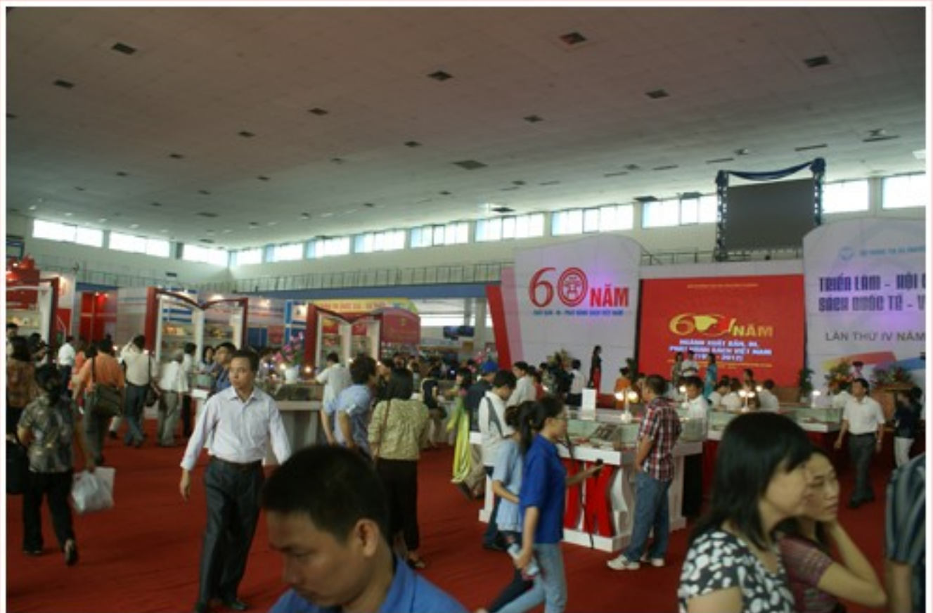
L'Exposition aux Heiteurs visitent le stand de la Bibliothèque nationale du Vietnam au centre de