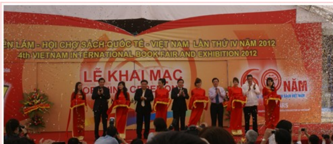
Inauguration de l'Exposition - Foire