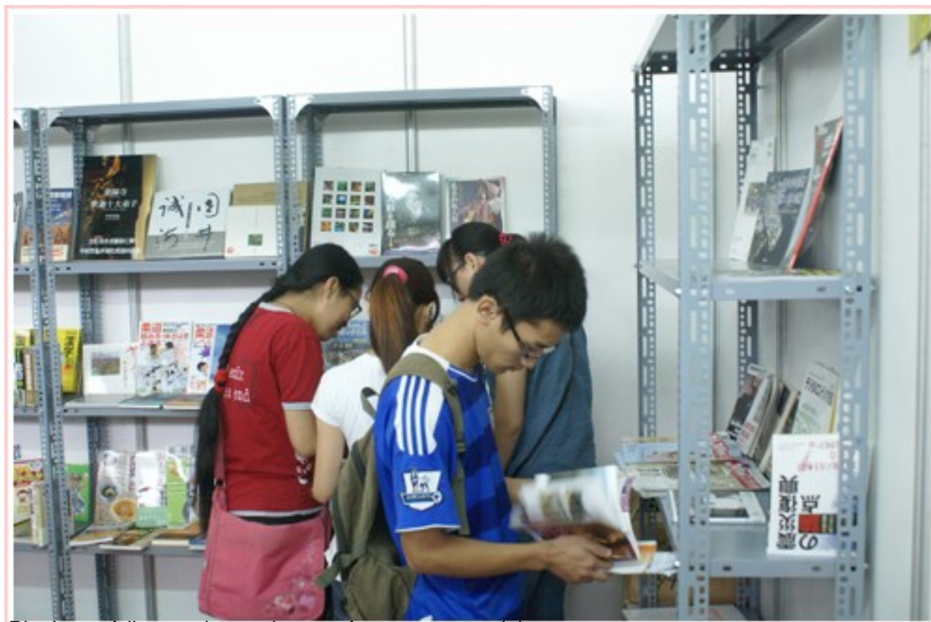
Novelle éditeurs Hanoï et étrangers y participant