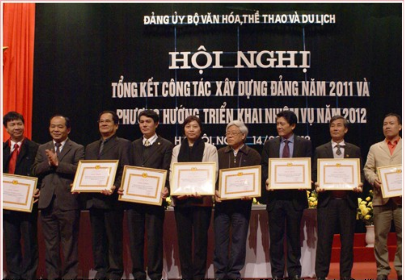
Đảng ủy Bộ Văn hóa, Thể thao và Du lịch trao tặng Bằng khen cho các đồng chí lãnh đạo và cán bộ của Bộ Văn hóa, Thể thao và Du lịch đã có những đóng góp tích cực trong công tác xây dựng Đảng năm 2011 và triển khai nhiệm vụ năm 2012.