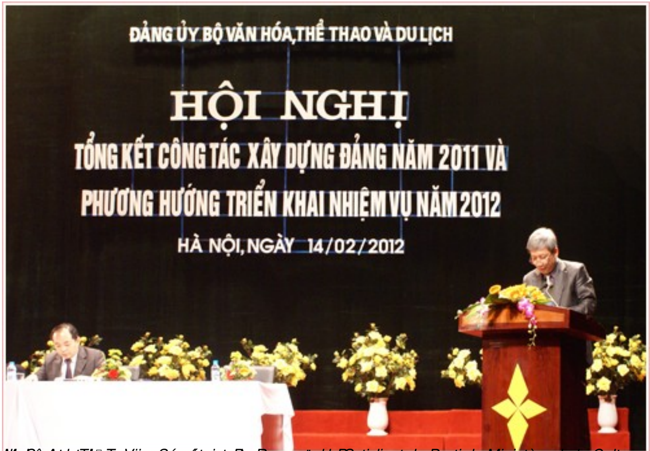
Mu Sè Anh Thu Tô Misa Sèprèaintè Pèrhapontè de Syndicat du Parti de Ministère de la Culture,