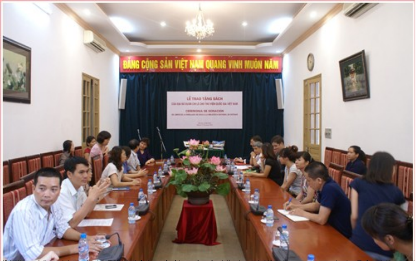
Ảnh chụp tại buổi lễ trao tặng sách của Đại sứ quán Chile cho Thư viện Quốc gia Việt Nam.