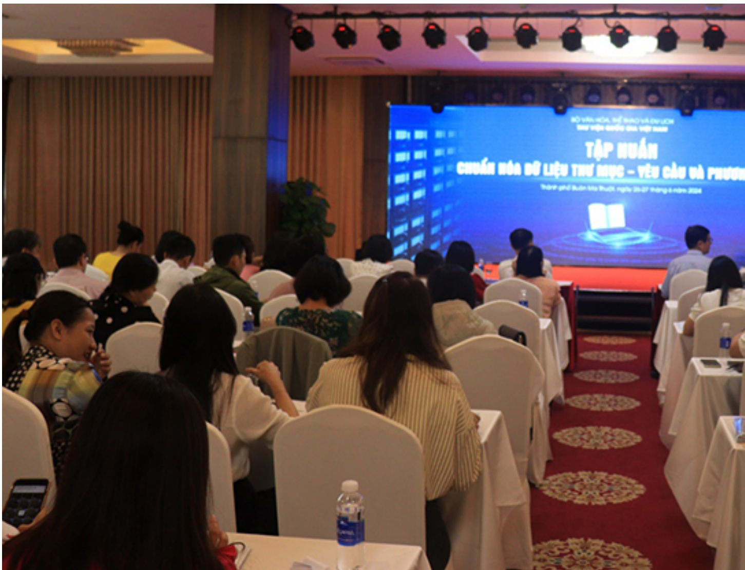
Aperçu de l'Atelier de Formation sur la Normalisation des Données Bibliographiques : Exigences et Méthodes

Dans le cadre de l'application de la décision n° 2175/QĐ-BVHTTDL, en date du 23 juillet 2021, émanant du ministre de la Culture, des Sports et du Tourisme, visant à mettre en œuvre le programme de transformation numérique des bibliothèques d'ici 2025, avec une perspective jusqu'en 2030, la Bibliothèque nationale du Viet Nam (BnV) a planifié des actions concrètes pour 2024. Ainsi, les 26 et 27 juin 2024, la BnV a organisé à Buon Ma Thuot, dans la province de Dak Lak, un cours de formation intitulé “Normalisation des données bibliographiques – Exigences et méthodes”.