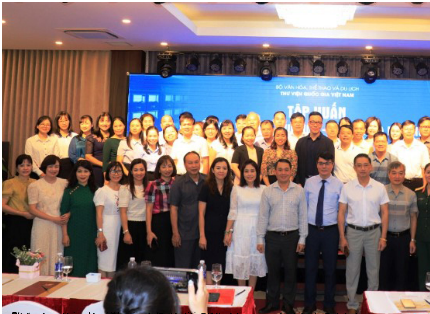
Rédaction: Hong Van, Huyen Thi Binh và Thị Bích Redaction: Hong Van, Huyen Thi Binh và Thị Bích Bibliothèque provinciale de Dak Lak