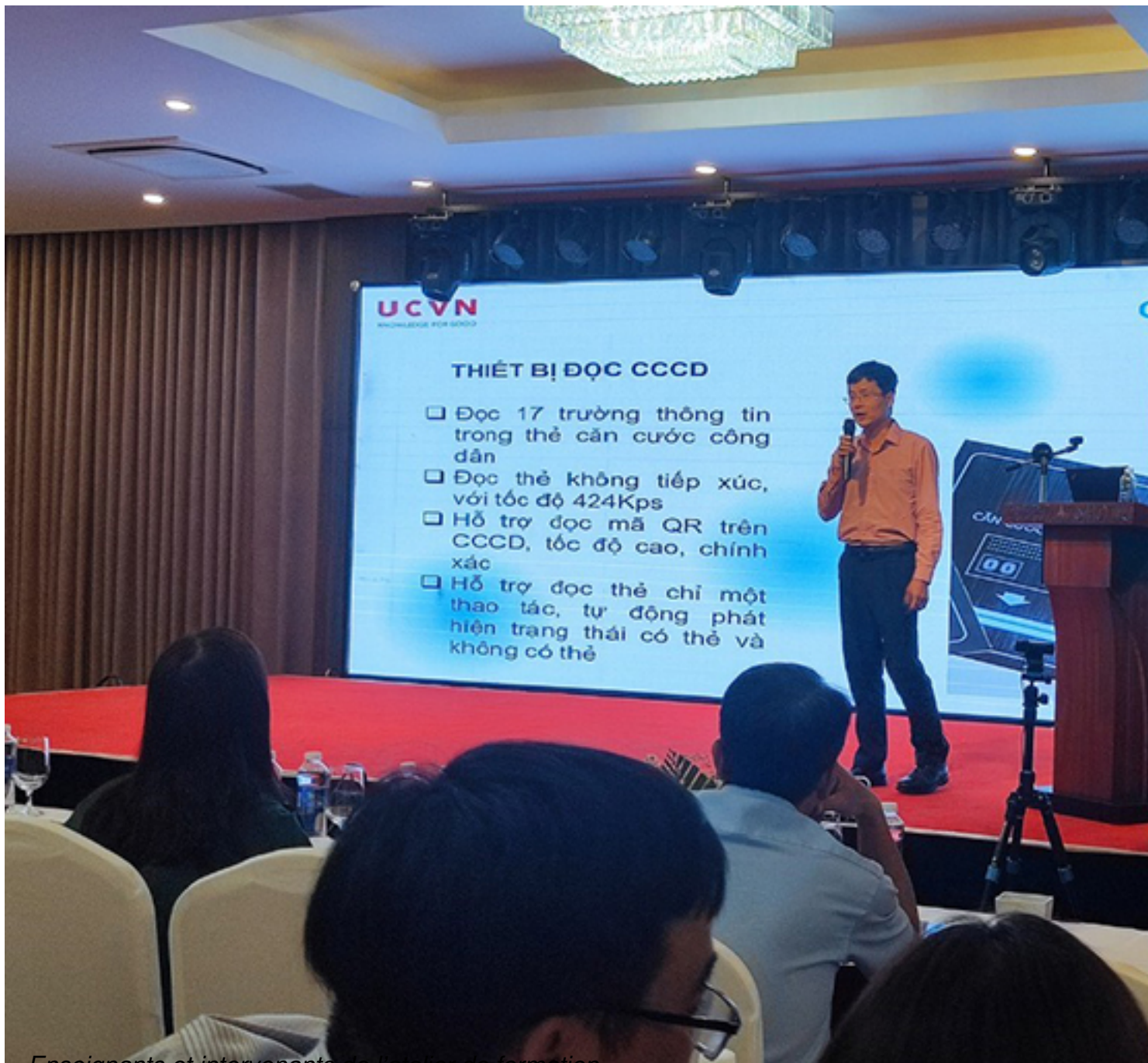
Enseignants et intervenants de l'atelier de formation