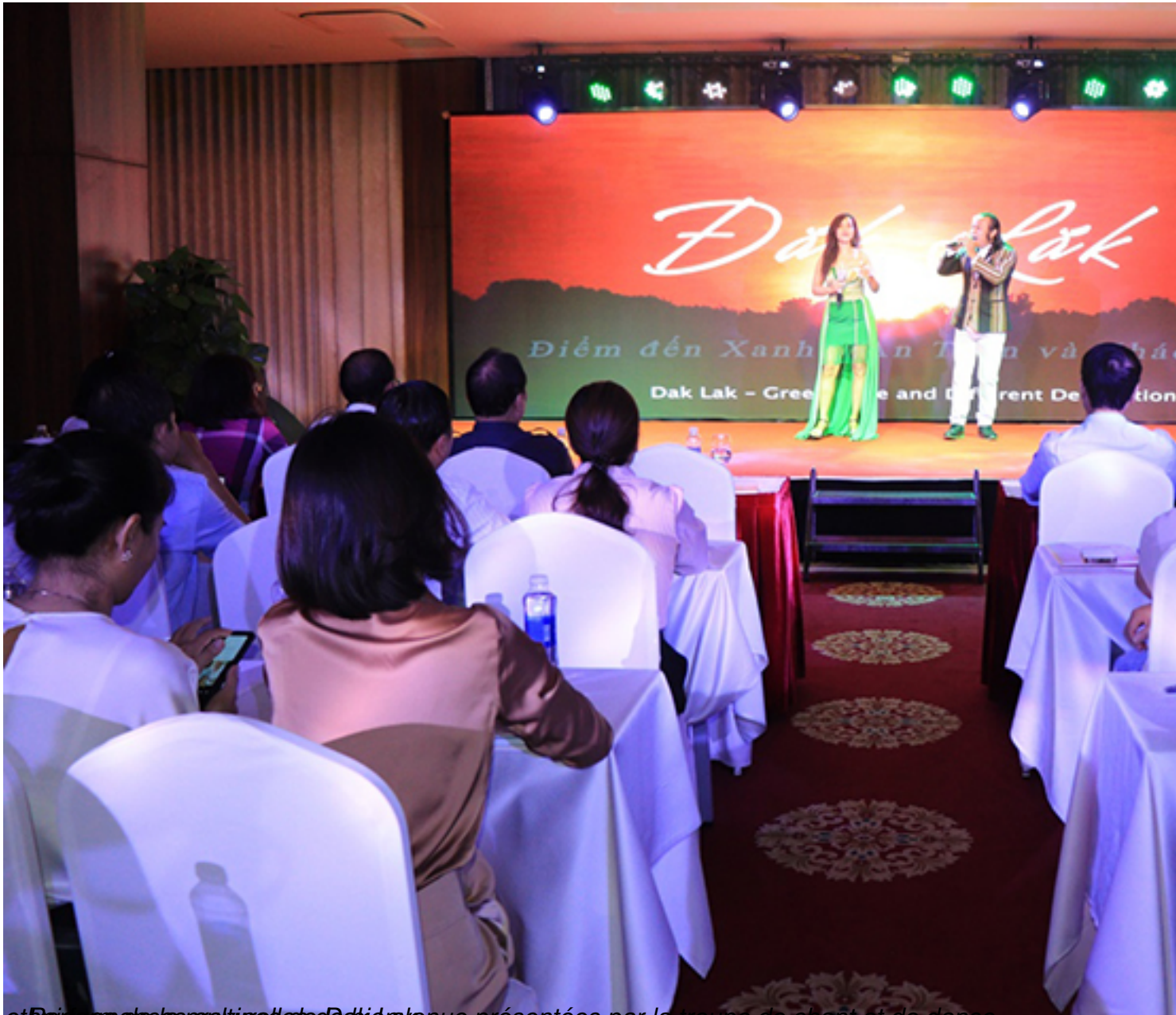
Maquettes de la politique de Dak Lak venue présentées par la troupe de chant et de danse