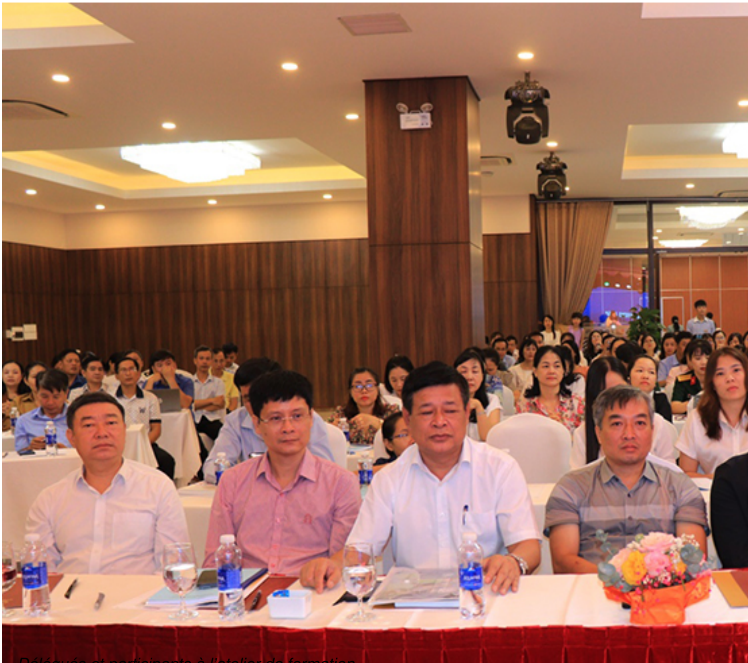
Délégués et participants à l'atelier de formation