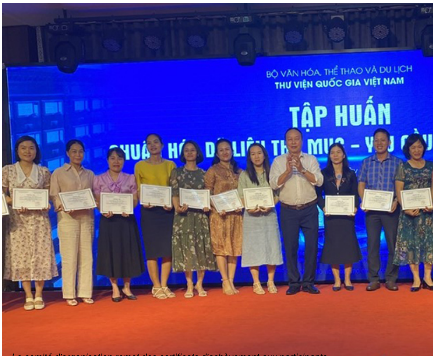
Le comité d'organisation remet des certificats d'achèvement aux participants