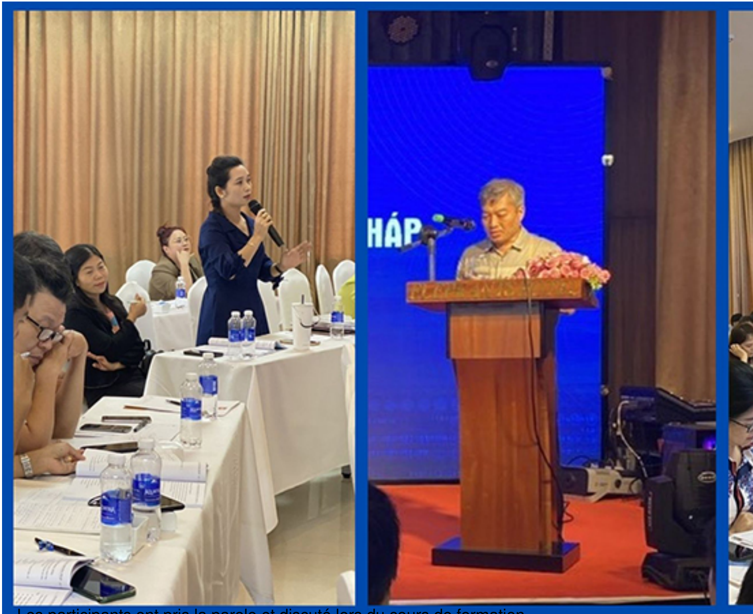
Les participants ont pris la parole et discuté lors du cours de formation