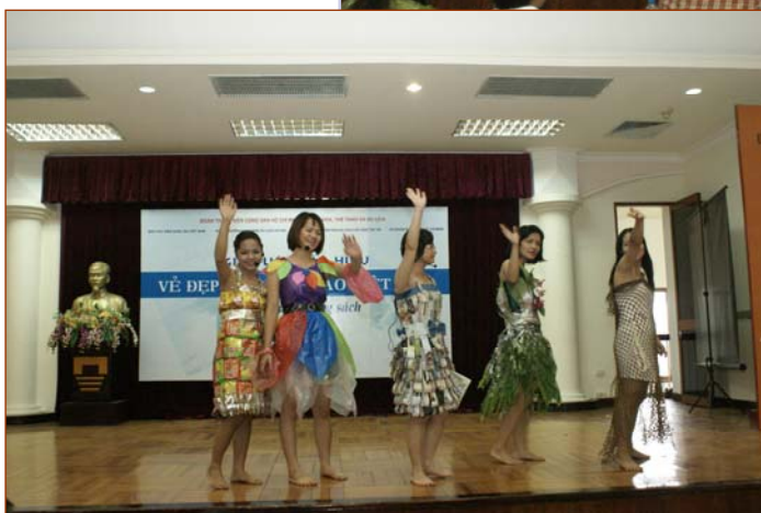
Các đội đã chuẩn bị các phần thi ấn tượng và độc đáo