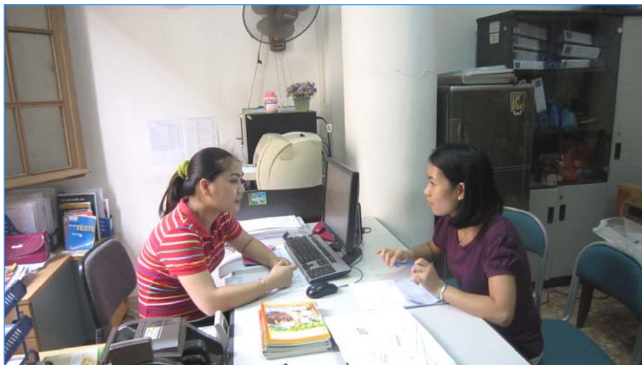
Các đội đi vận động bầu chọn

Cuộc bầu chọn lần này được chia thành 2 giai đoạn: Giai đoạn 1 từ 11h11' ngày 11 đến 11h11' ngày 14/10/2011; giai đoạn 2 từ 14/10/2011 đến 11h11' ngày 11/11/2011