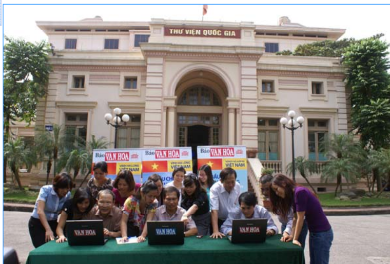
Phối hợp cùng báo Văn Hóa bầu chọn cho Vĩnh Hạ Long

Ngay sau đợt vận động bình chọn, công đoàn TVQGVN tiếp tục kết hợp đợt vận động bầu chọn cho Vĩnh Hạ Long kết hợp cùng Báo Văn Hóa. Buổi lễ vận động, bầu chọn được tổ chức trước sảnh nhà E đã tạo một không khí vui tươi sôi nổi và thu hút đông đảo bạn đọc tham gia.