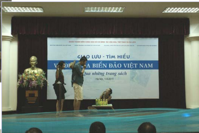
Cuộc thi đã diễn ra sôi động và lôi cuốn

Cuộc thi có ý nghĩa lớn; góp phần tuyên truyền kiến thức về biển, đảo Việt Nam tới đông đảo đoàn viên thanh niên, tạo sân chơi, giao lưu gắn kết cho thanh niên các chi đoàn