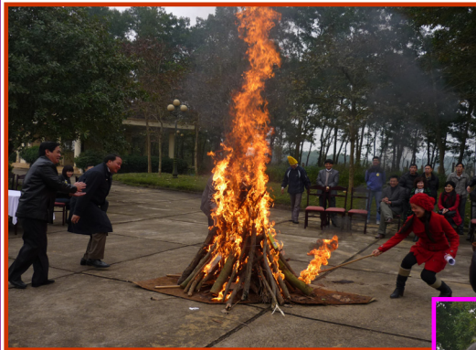
Các đồng chí lãnh đạo thắp ngọn lửa trại, khởi động cuộc thi.