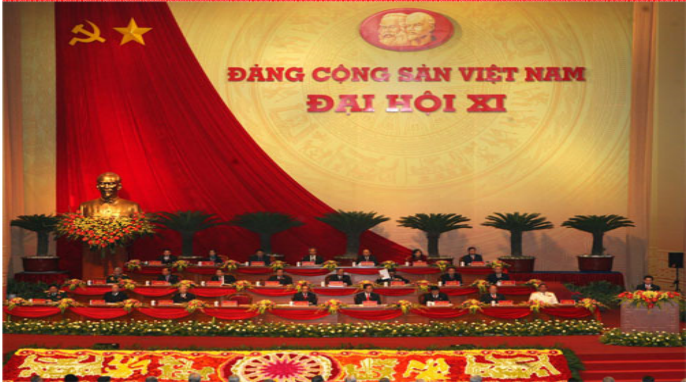
Đảng cộng sản Việt Nam - Đại hội XI