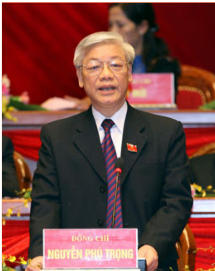
Đồng chí Nguyễn Phú Trọng

Tổng Bí thư Đảng cộng sản Việt Nam Khóa XI