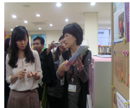
Giới thiệu thư viện