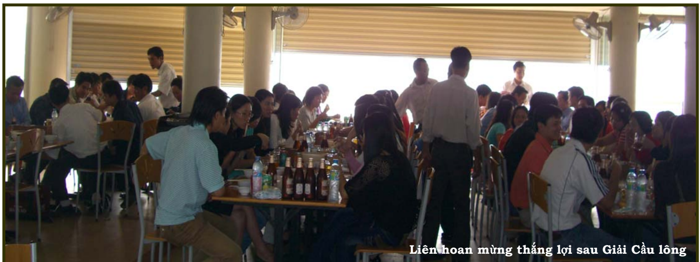
Liên hoan mừng thắng lợi sau Giải Cầu lông