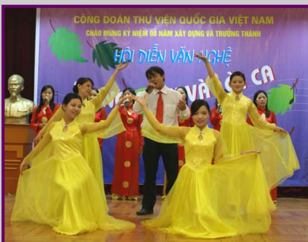
Tốp ca nam nữ phòng Đọc với bài hát “Giai điệu Tổ Quốc” của Trần Tiến