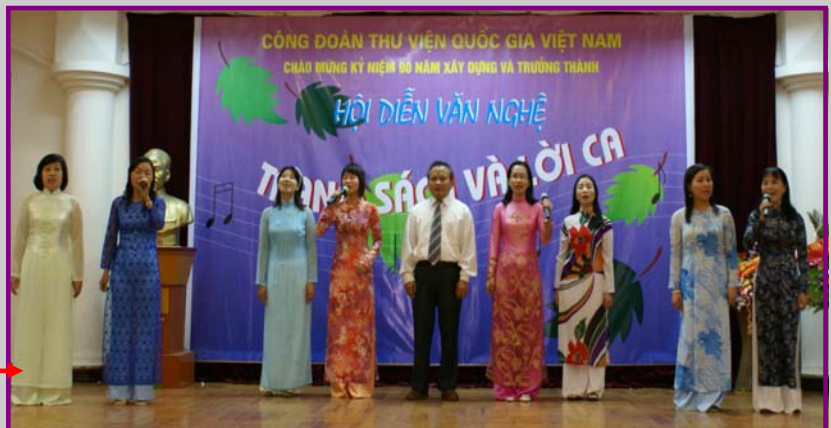
Tốp ca nam nữ p. Lưu chiều với "Việt Nam ơi, mùa xuân đến rồi" của Huy Du