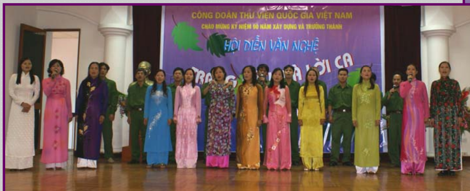
Tốp ca nam nữ phòng Hành chính mở màn Hội diễn với bài hát “Tiên bước dưới quân kỳ” của Đoàn Nho