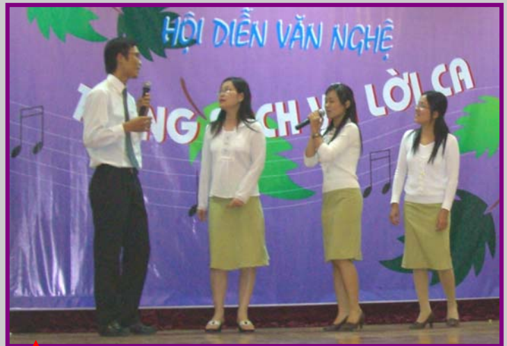
Tốp ca nam nữ phòng Tạp chí Thư viện với bài hát "Thành phố trẻ" của nhạc sĩ Trần Tiến