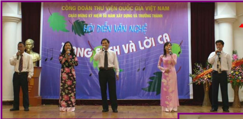
Tốp ca nam nữ phòng Nghiên cứu với bài hát “ Tiếng hát những đêm không ngủ ” của tác giả Phạm Tuyên