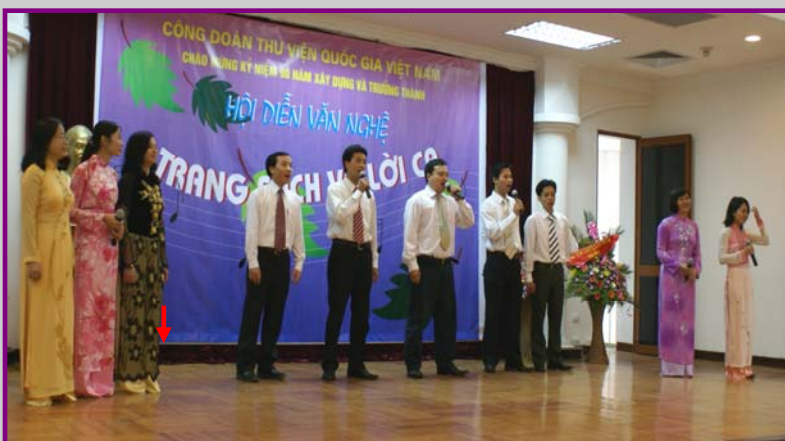
Tốp ca nam nữ phòng Tin học với bài hát “ Tiến về Hà Nội ” của tác giả Văn Cao