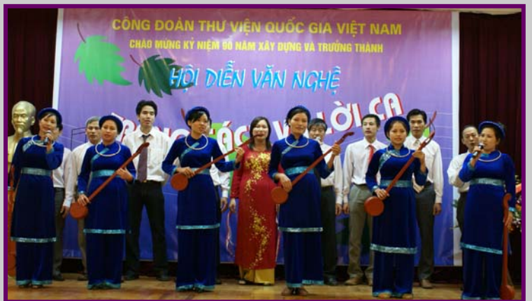
Tốp ca nam nữ phòng Bảo Quán với bài hát "Việt Bắc nhớ Bác Hồ" của tác giả Phạm Tuyên