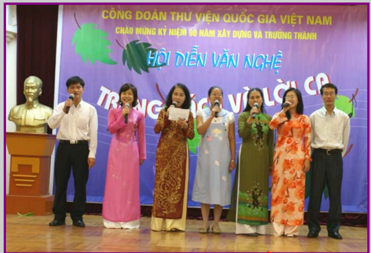
Tốp ca nam nữ phòng Tra cứu với bài hát "Chào mừng Đảng lao động Việt Nam" của tác giả Đỗ Minh