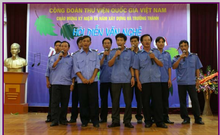
Tốp ca nam Tổ Bảo vệ với “Bác đang cùng chúng cháu hành quân” của Huy Thục