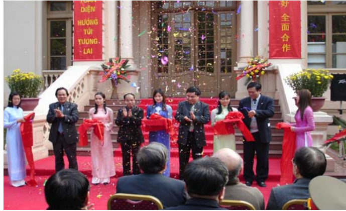
Lễ cắt băng khai mạc triển lãm sách báo Trung Quốc