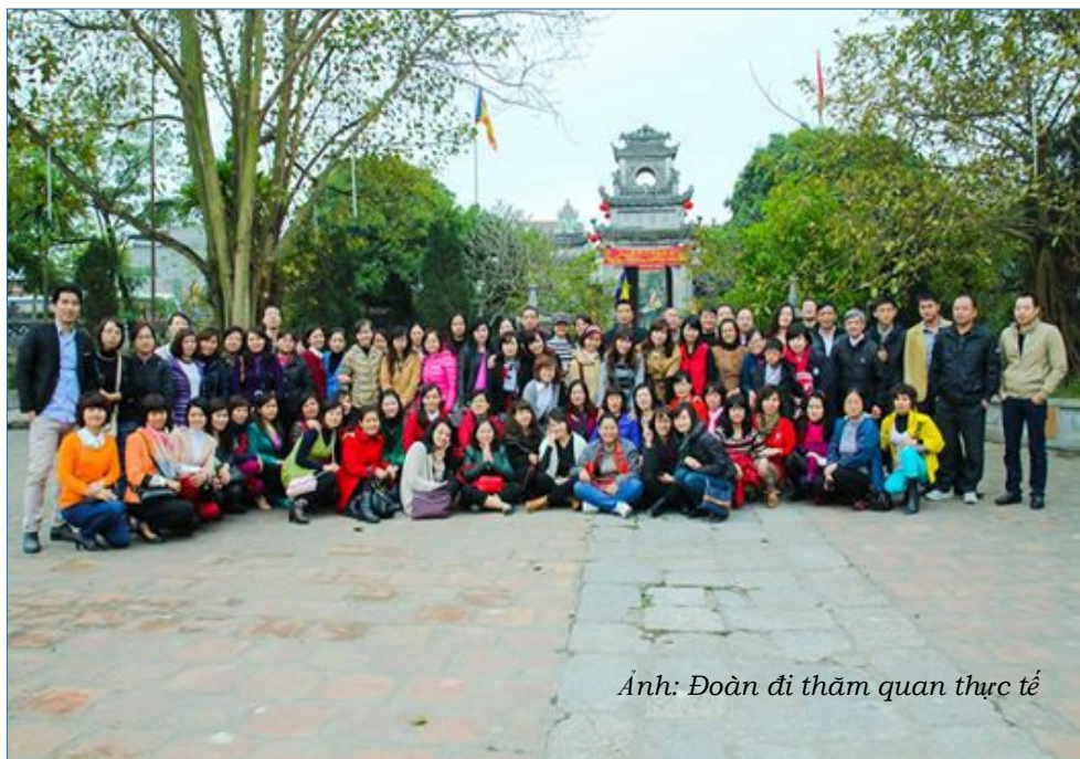
Ảnh: Đoàn đi thăm quan thực tế