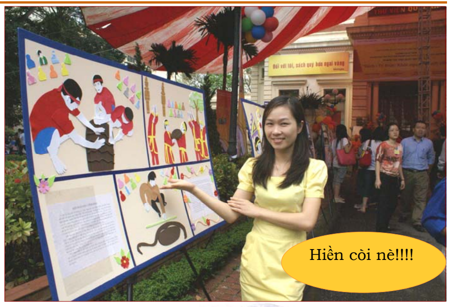
Hiền còi nè!!!!