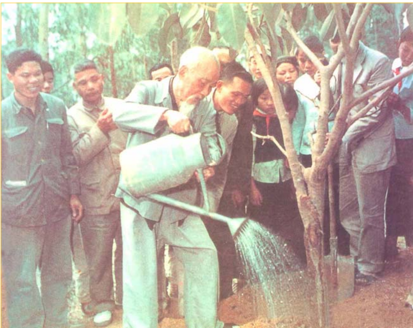
Bác Hồ trồng cây

Người cho rằng bốn đức tính cần, kiệm, liêm, chính là nền tảng tất yếu để tạo nên giá trị con người, là thước đo phẩm chất con người. Nếu thiếu một trong bốn đức tính đó thì cũng không trở thành con người hoàn thiện được. Việc học tập theo tư tưởng của Người tưởng chừng rất dễ, nhưng lại không có mấy người thực hiện được. Vậy, chúng ta hiểu gì về “Cần, Kiệm, Liêm, Chính”? Chúng ta đã làm gì để rèn luyện được những đức tính ấy?