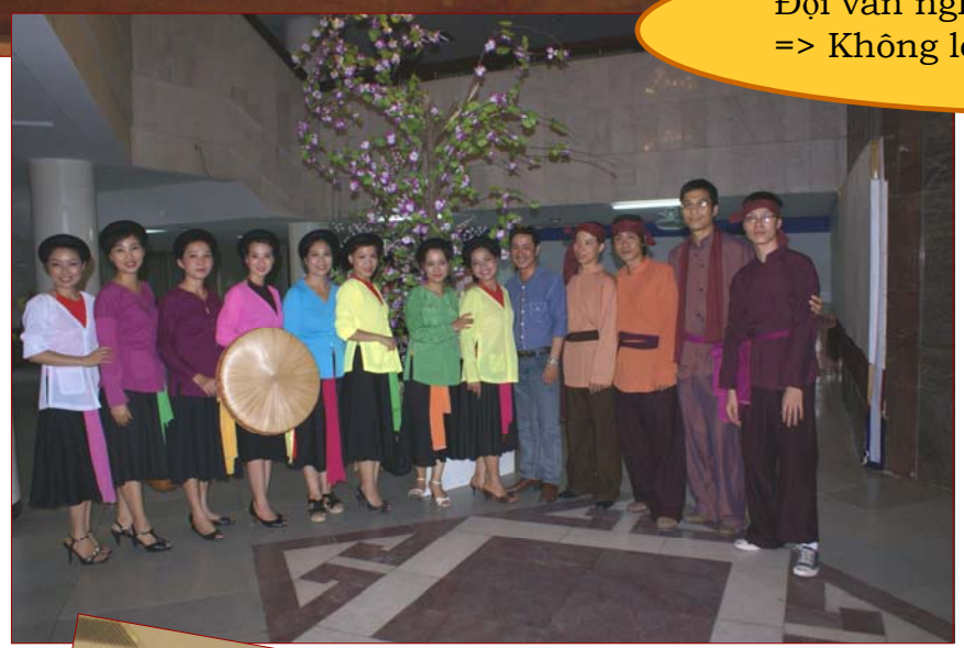
Đội văn nghệ rất nhiều nam ca sĩ => Không lép về tí nào!