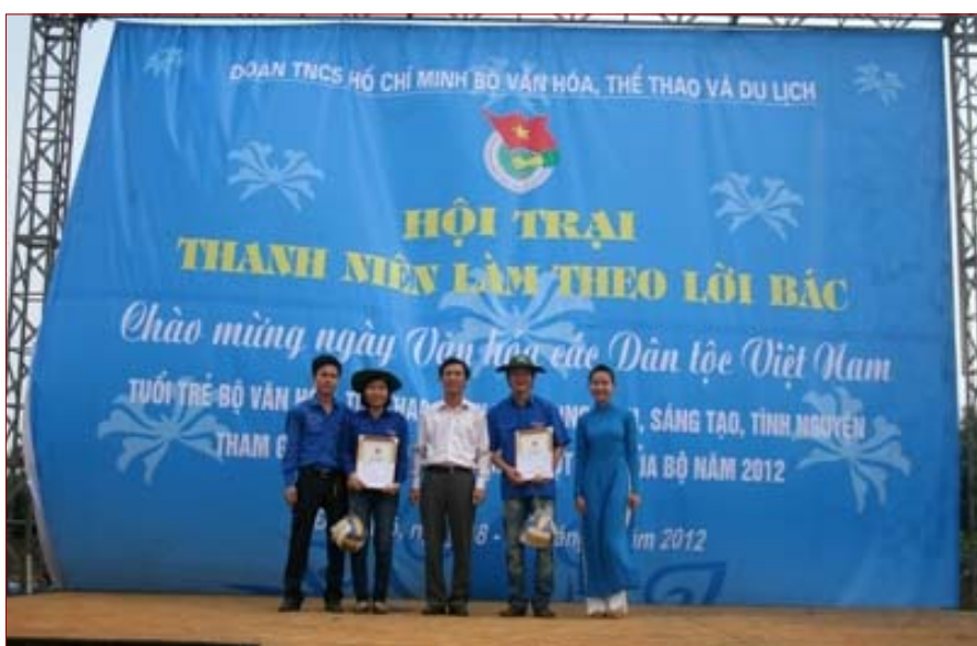
Các đơn vị nhận giải

Trong khuôn khổ liên hoan Văn hóa các dân tộc Việt Nam, 19h ngày 18/4/2012, hội trại "Thanh niên Bộ Văn hóa, Thể thao và Du lịch làm theo lời Bác" theo chủ đề “Tuổi trẻ Bộ Văn hóa, Thể thao và Du lịch xung kích, sáng tạo, tình nguyện tham gia thực hiện 19 nhiệm vụ đột phá năm 2012” đã khai mạc tại Khu các Làng dân tộc IV, Làng Văn hóa - Du lịch các dân tộc Việt Nam.