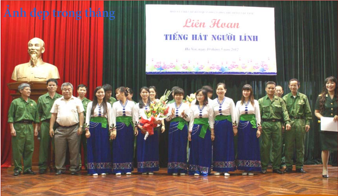
Ảnh đẹp trong tháng