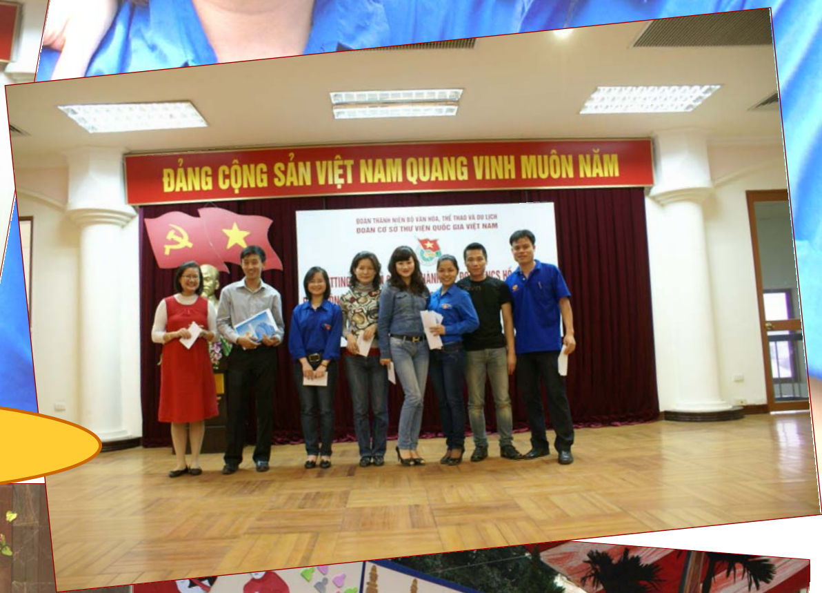
Đoàn viên duyên dáng trong các hoạt động đoàn!