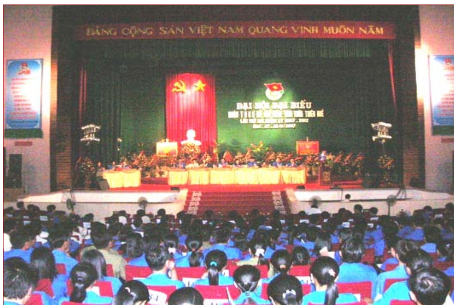
Đại hội đại biểu Đoàn TNCSHCM Tỉnh Thừa Thiên Huế lần thứ XIII

Thực hiện chỉ đạo của Đảng ủy Bộ Văn hoá, Thể thao và Du lịch, căn cứ Hướng dẫn số 07 HD/ĐTNK ngày 11/11/2011 về việc tổ chức Đại hội các cấp tiến tới Đại hội đại biểu Đoàn Khối các cơ quan Trung ương lần thứ II, nhiệm kỳ 2012 - 2017. Ban Chấp hành Đoàn TNCS Hồ Chí Minh Bộ Văn hoá, Thể thao và Du lịch xây dựng Kế hoạch tổ chức Đại hội đại biểu Đoàn TNCS Hồ Chí Minh Bộ Văn hoá, Thể thao và Du lịch lần thứ I, khoá II nhiệm kỳ 2012 - 2017 với những nội dung chính như sau: