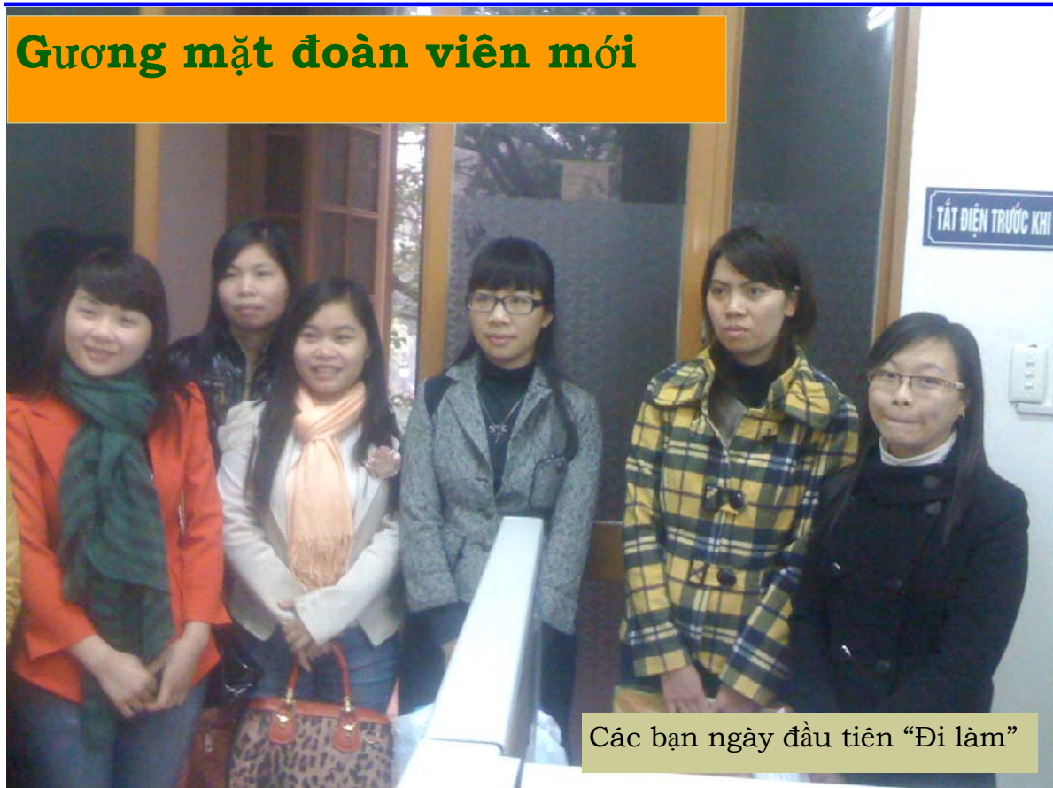
Các bạn ngày đầu tiên “Đi làm”

Vậy là lực lượng thanh niên của Đoàn cơ sở TVQGVN lại có thêm những gương mặt mới. BBT xin giới thiệu tới các bạn chân dung các đoàn viên mới. Chúc các bạn Luôn tươi trẻ, luôn luôn là lực lượng xung kích trong các hoạt động thanh niên!