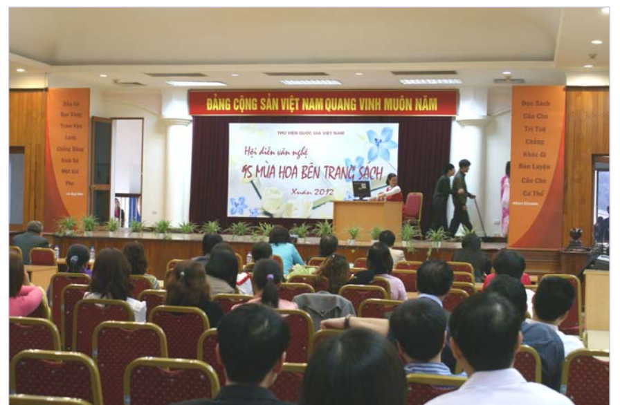
Tổng hợp tin: Thu Trang

Hội diễn đã diễn ra với 22 tiết mục văn nghệ và tiểu phẩm do các diễn viên không chuyên đến từ 13 tổ công đoàn biểu diễn. Những hoạt động hàng ngày, những tình huống thường nhật trong hoạt động chuyên môn, trong sinh hoạt đời thường của cán bộ thư viện được thể hiện qua lăng kính hài hước nhằm mang lại những tiếng cười sảng khoái cho người xem. Đồng thời các tiểu phẩm đã chuyển tải những thông điệp có ý nghĩa nhân văn: tôn vinh văn hóa đọc, tôn vinh nghề Thư viện; ca ngợi lòng yêu nghề, sự gắn bó với ngôi nhà chung thân yêu – Thư viện Quốc gia Việt Nam của mỗi viên chức thư viện.