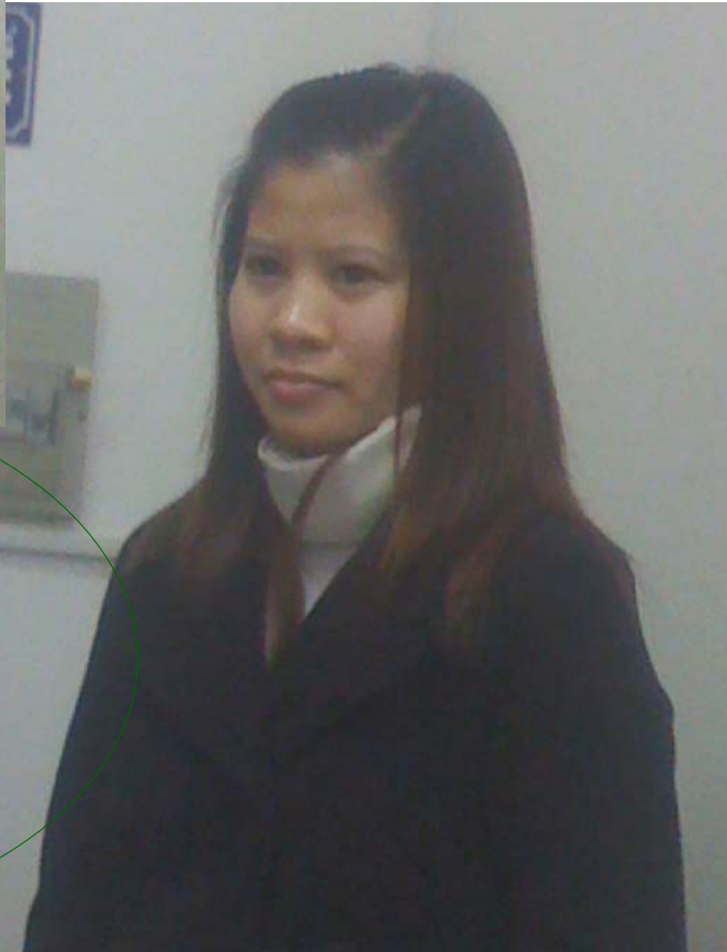
Tác giả bài viết: “Như là “duyên” không hẹn” số này