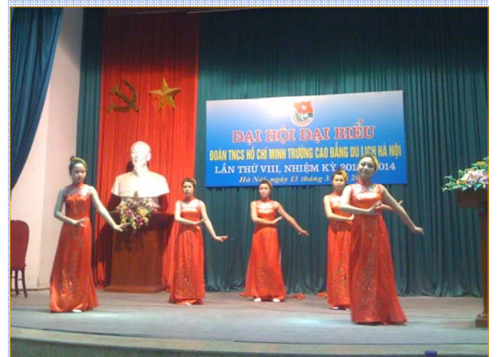
Tiết mục Văn nghệ chào mừng Đại hội do đoàn viên Đoàn trường biểu diễn