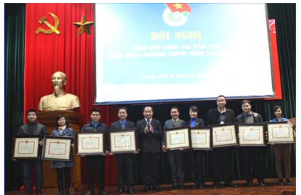
Các đơn vị nhận bằng khen của Bộ trưởng