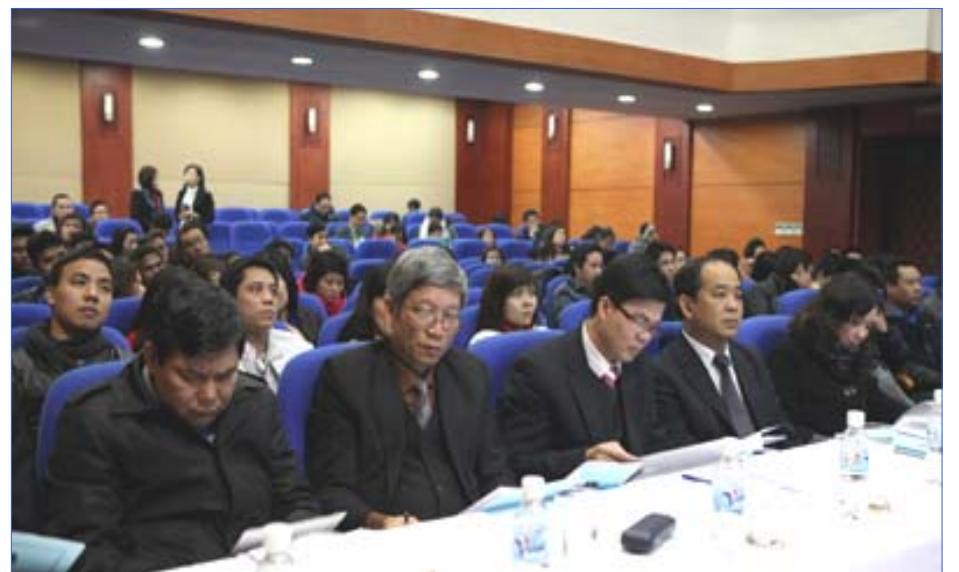
Các đại biểu tham dự Hội Nghị