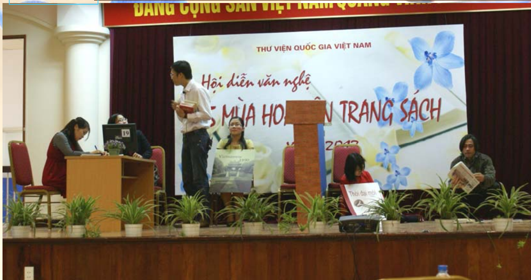
Toàn bộ "quân số phòng này" đều ở trên sân khấu!