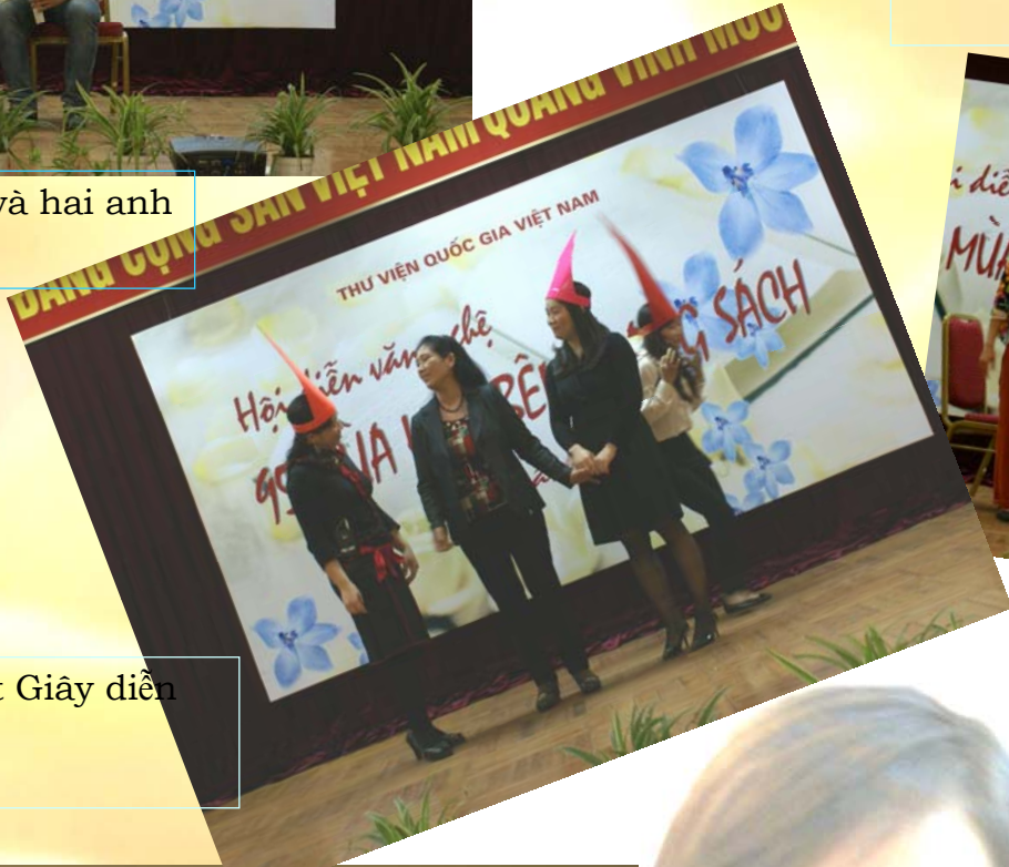
Ba nàng Giờ, Phút Giây diễn rất ngọt ngào