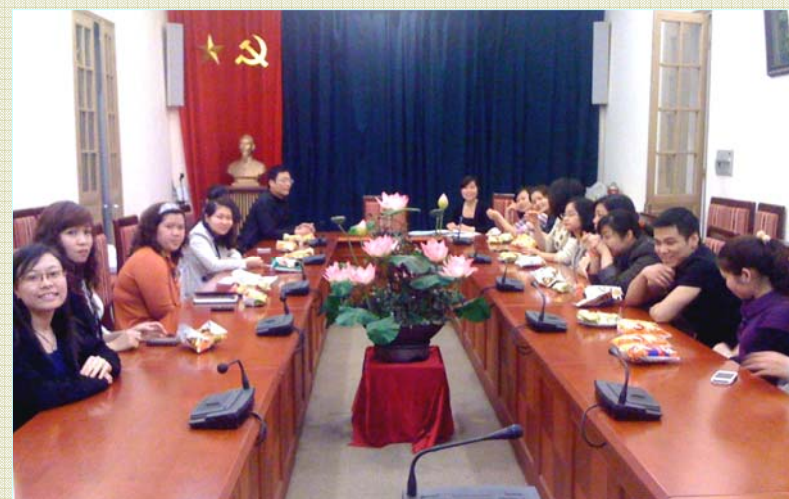
Chi đoàn II - Đoàn CS TVQGVN Tổng kết và triển khai tháng thanh niên