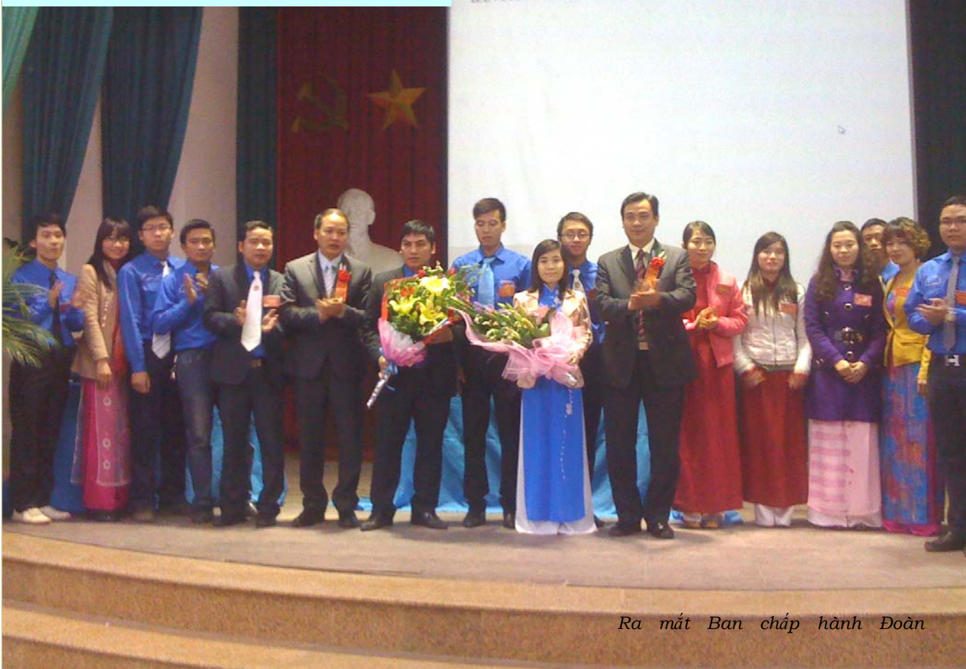
Ra mắt Ban chấp hành Đoàn