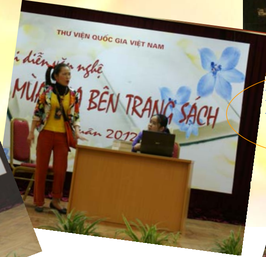
Những diễn viên tiềm năng!