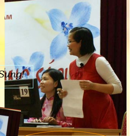
Bí thư "Bầu bí" vẫn diễn Sung!