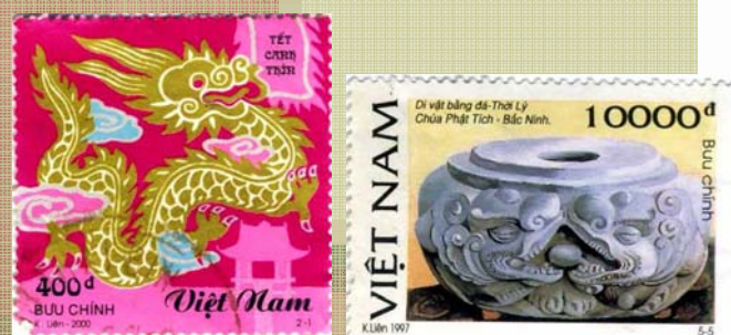
Rồng trên tem Việt