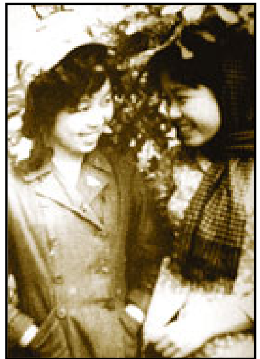
Đặng Thuỳ Trâm (trái) và em gái trước ngày vào Nam

Thư viện Đặng Thuỳ Trâm dự định sẽ khánh thành vào 19/05/2006 tại Đức Phổ - Quảng Ngãi, sẽ góp phần mang lại cho nhân dân nơi đây nhiều niềm vui và niềm tin mới, giúp mọi người nâng cao trình độ, mở mang kiến thức để cuộc sống của họ ngày một tốt hơn.