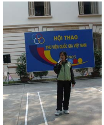
Lời bình trang 6,7: Thùy Dung