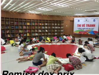
Remise des prix