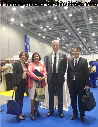
NLV delegation met with IFLA President and General Secretary