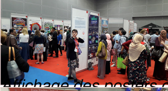
Attirance des visiteurs dans le cadre de l'IFLA WLIC 2018