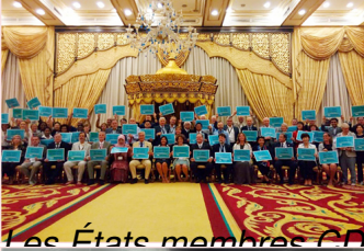
Les États membres de l'UNESCO s'engagent à promouvoir l'initiative Vision Globale