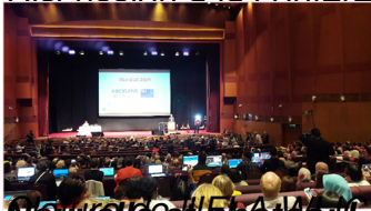
Nouvelles et photos: Le Quynh Hoa