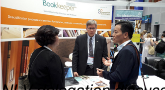
NLV delegation discussed solutions for preservation of materials