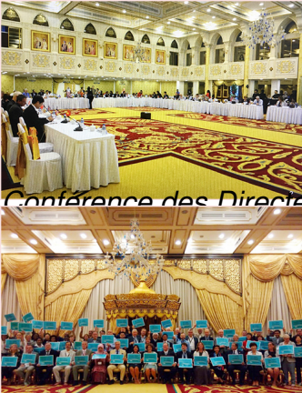
Conférence des Directeurs de bibliothèques nationales du monde