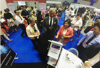
2018, la délégation de la BNL s'entretient avec le Président et le Secrétaire Général de l'IFLA WLIC