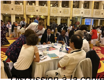
Discussion à la conférence CDNL